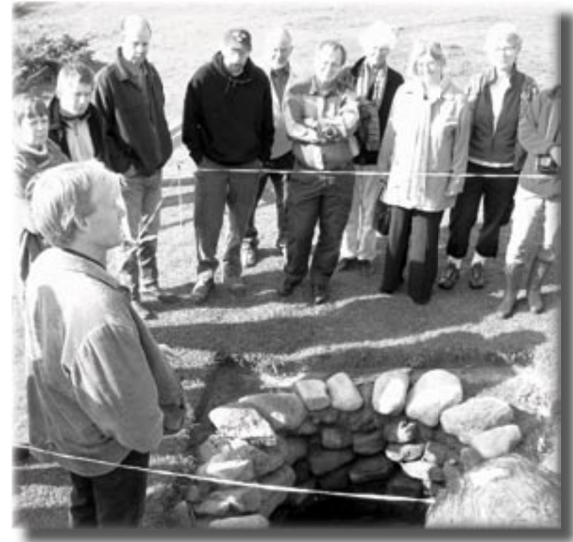
fortsätta i takt med att medel sätts till.

Vårens kultur- miljövandring gick av stapeln i trakten av Rolfstorp där vi besökte "kända och okända" gravhögar och gravrösen från